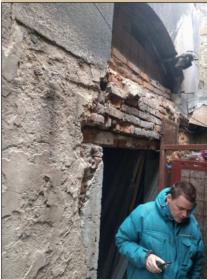
pohled na dveře z exteriéru